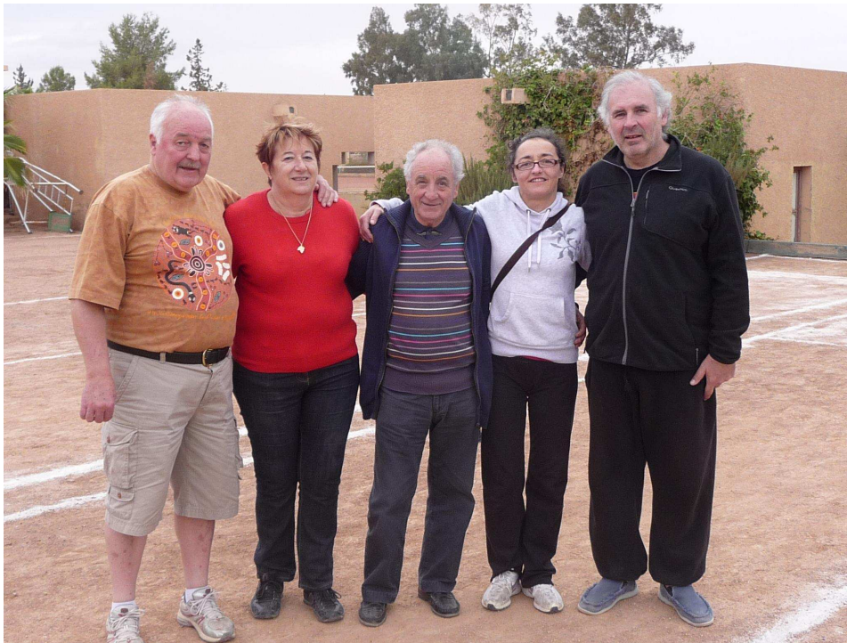
Finalistes du Tournoi double mixte de Ouarzazate