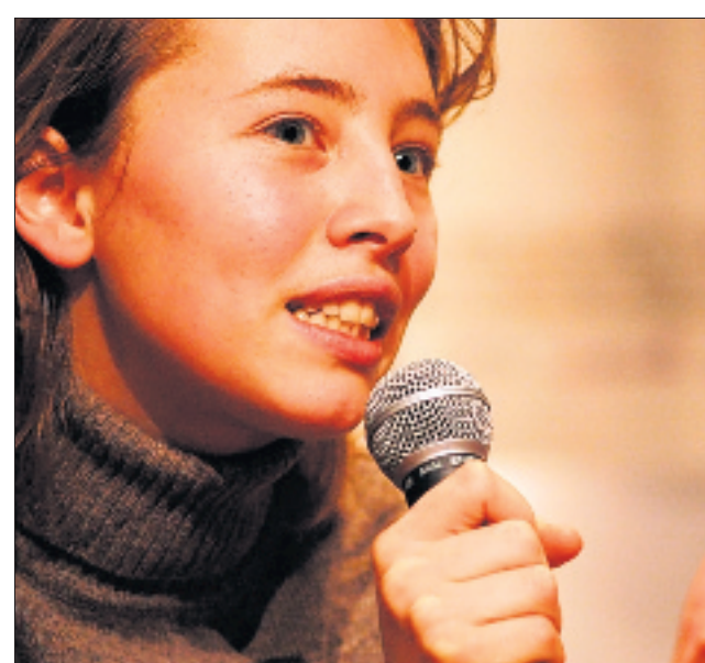
Isild Le Besco tournera à nouveau avec Benoît Jacquot. Elle était à l'automne dernier invitée des Rencontres des cinémas d'Europe à Aubenas.

Les postulants doivent prendre en contact à casting@rêVe-net ou au 04 75 35 98 93. Il vous sera demandé une fiche de renseignement, une photo en gros plan, une en pied, vos mensurations et un CV.