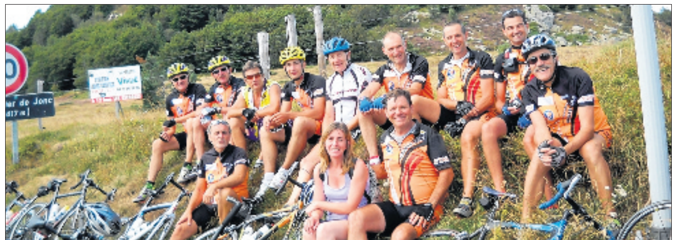
Une belle balade pour les cyclotouristes.

E n ce vendredi caniculaire, les routiers du CTAV (cyclotourisme Aubenas-Vals) ont effectué une nouvelle randonnée à la journée à la fraîcheur de la montagne. Partis de Mézilhac, ils ont pris la direction du Béage, Issarlès puis les plateaux de la Haute-Loire, par Monastier, Laussonnes, Saint-Front, et Fay-sur-Lignon. Ils ont ensuite gravi la redoutable pente de la croix de Peccata au pied du Mézenc. Après une pause aux Estables, le retour s'est effectué par le Gerbier de Joncs.