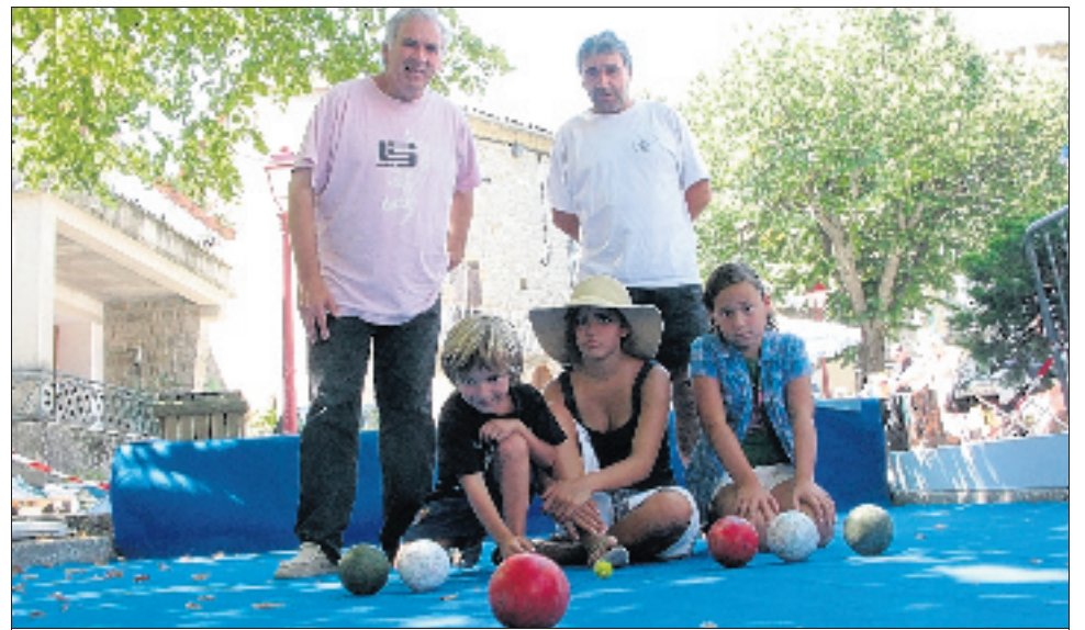
Des boules aux couleurs de l'Italie. Les enfants d'Antraigues s'initient déjà à la rafavolo.

Déjà, les enfants d'Antraigues profitent pour faire cogner les boules. Mais à partir du 25, de vrais professionnels du jeu, venus de Rome, seront présents. « Il y aura sept personnes, des joueurs, des techniciens. Ils tiendront un stand et feront des démonstrations. On fait venir aussi des Bretons qui pratiquent la rafavolo car cela se rapproche de la boule bretonne. »