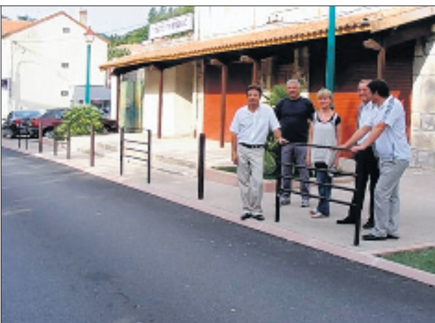
Dans un souci d'homogénéité, ces barrières ont la même couleur que les bancs publics et les plots de protection.

Il est à souligner que ces barrières destinées avant tout à protéger les piétons sont également esthétiques. Elles s'intègrent parfaitement avec l'avenue.