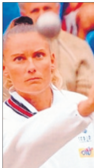
L'entrée est libre pour assister aux démonstrations des championnes.

à 20 heures, réception et repas de clôture au Casino.