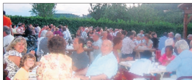
Une soirée repas et documentaire.

De nombreux villageois, touristes et voisins étaient présents sur la place du village pour cette soirée qui comprenait deux animations : repas et cinéma.