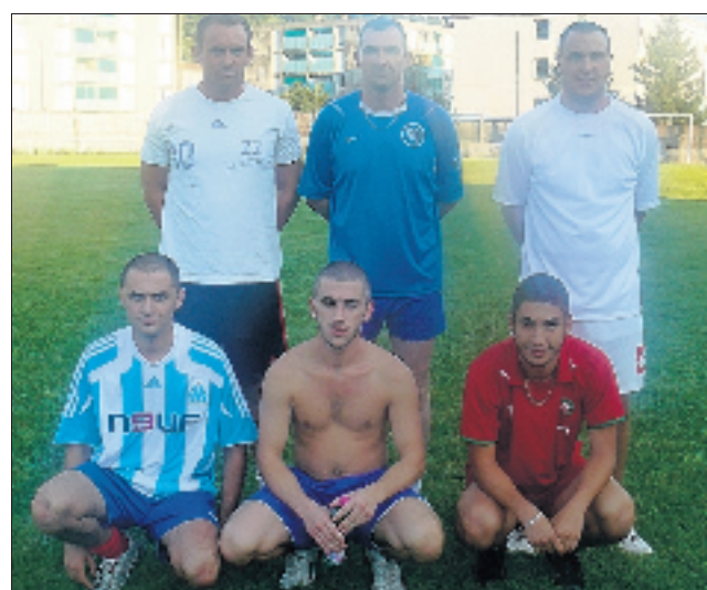
Les recrues apporteront beaucoup offensivement.