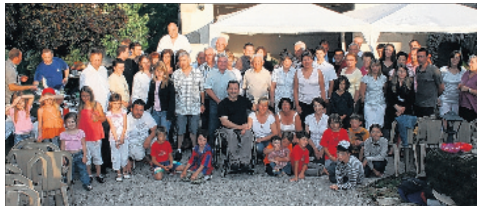
Les voisins réunis ont pu profiter du soleil malgré un violent orage.

Après un violent orage, le soleil est revenu juste à temps samedi soir pour que la fête de quartier du hameau Les Douces puisse se dérouler dans les meilleures conditions. La soirée a commencé par un apéritif ac-