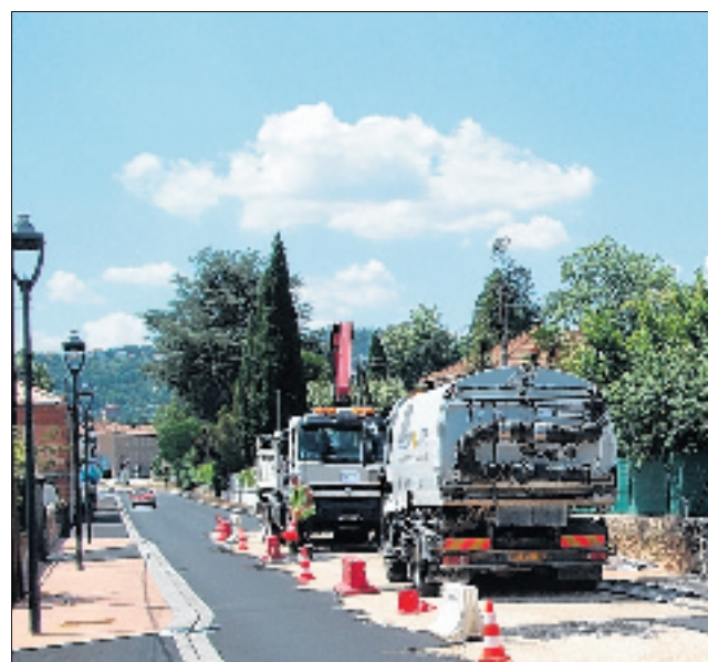
Un travail de précision malgré la circulation.

Le surfacage des deux zones piétonnes de 46 mètres chacune au chantier du Poisson vient d'être réalisé.