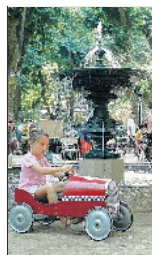
Il y aura des jeux pour tous les goûts... mais la voiture à pédales arrive toujours à faire des adeptes parmi les plus jeunes.

Centre culturel de Vals et du Vivarais, Véronique Pronier, coordinatrice, 3, avenue Claude-Expilly, 07600 Vals-les-Bains. Renseignements au 04 75 37 49 21 ; ou sur Internet : culture.vals@orange.fr