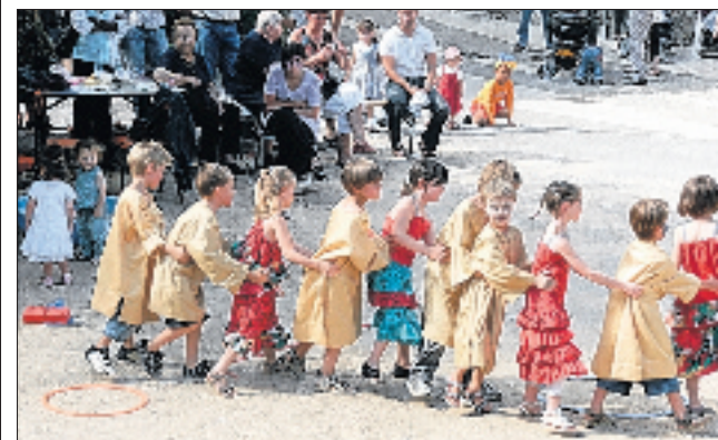
Les enfants ont réalisé une belle farandole.

Une très belle fête a eu lieu sur la place du village pour clore cette année scolaire. Les enfants des classes de maternelle et de primaire ont démontré leurs talents de chanteurs et danseurs devant des parents enthousiasmés. Animations, ateliers de maquillage, manège... c'était une après-midi festive pour tous. La soirée s'est terminée par un repas paella organisée par l'Amicale laïque.