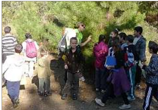
Les jeunes randonneurs au cours de leur périple.