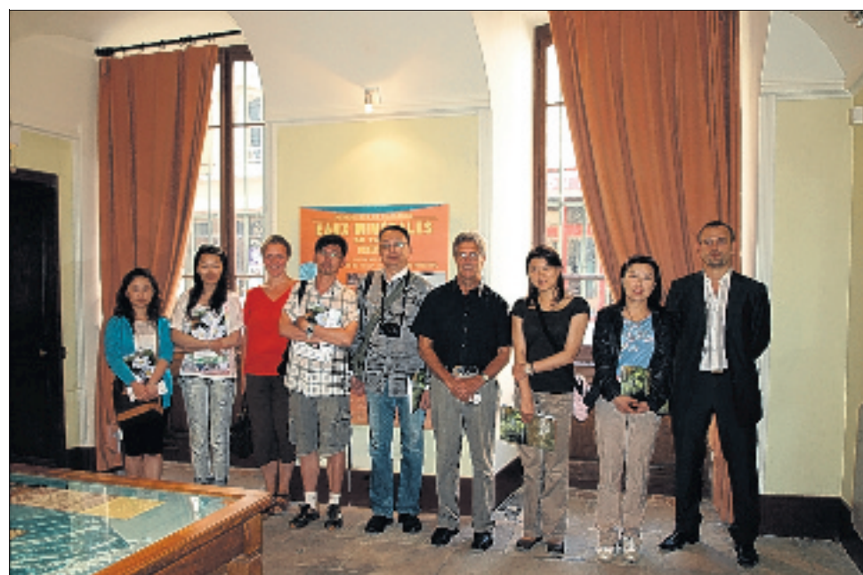
La délégation de journalistes chinois a pu découvrir les vertus de l'eau de Vals et des marrons ardéchois.