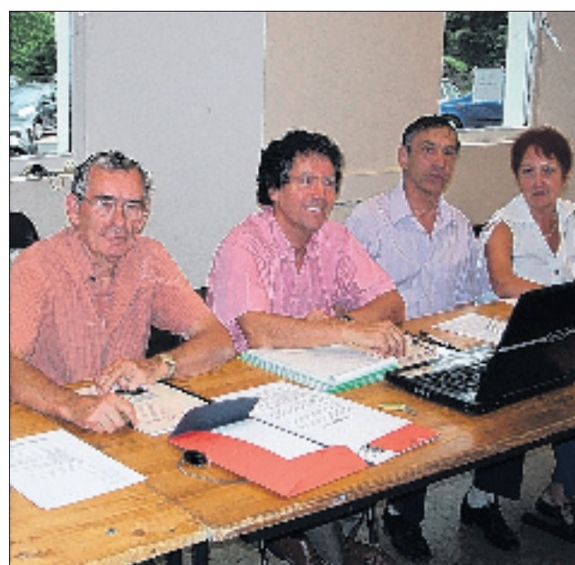
De grands projets sont à l'étude pour créer un établissement dans le nord du département.