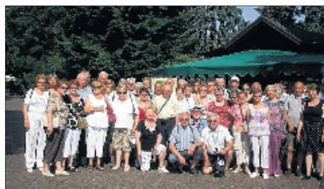
Les retraités ardéchois ont pu découvrir le magnifique lac de Côme.

C'est un circuit découvert des Lacs Italiens qu'a proposé la FNACA. Le groupe de 48 personnes est parti de Lavedieu avec l'Agence Evalys avec le concours des transports Arsac. Lacs de Garde, de Come, Majeur et d'Or-